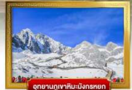
อุทยานภูเขาหิมะ-มังกรหยก