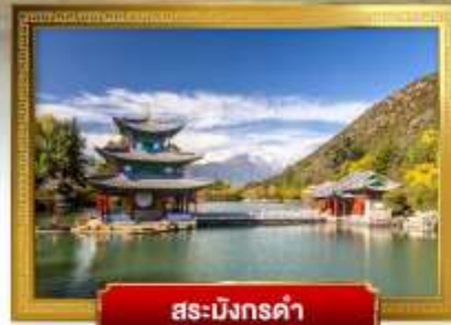
สระมังกรดำ