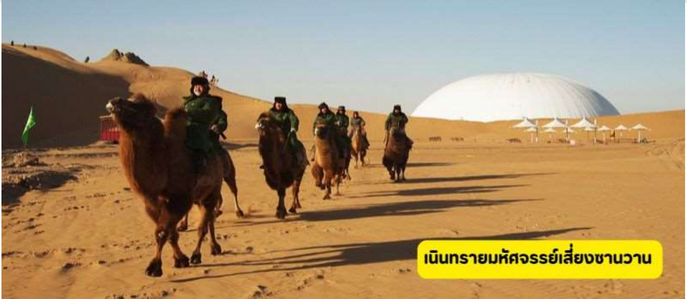
เนินทรายมหัศจรรย์เสียดงชานวาน

วันที่สี่ เมืองตงเซิน (Ordos City) – เนินทรายมหัศจรรย์เสียดงชานวาน (รวมกระเช้าไป-กลับ) – เล่นสไลด์ทรายที่เนินทรายเสียดงชานวาน (ไม่รวมค่าเครื่องเล่น) – โชว์ประเพณีการแต่งงานของชนเผ่าพื้นเมือง