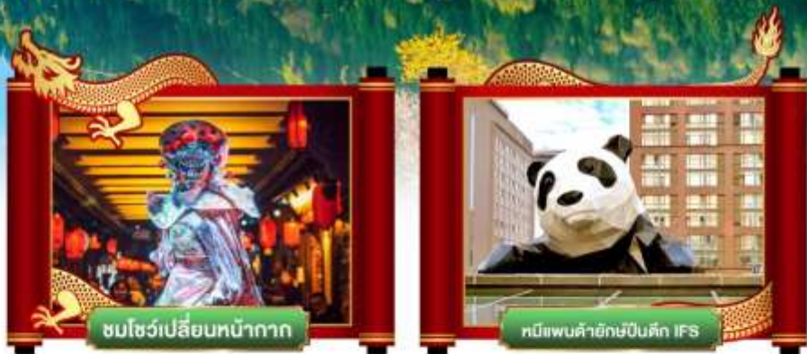
ชมโชว์เปลี่ยนหน้ากาก