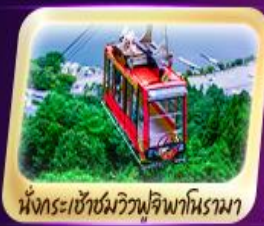
นั่งกระเช้าชมวิวฟูจิพานิราม่า