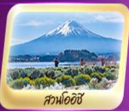
สวนโออิชิ