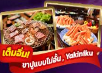
เต็มอิ่ม! บาบูนแบบไม่อื่น, Yakiniku