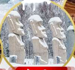
รูบีนฮินโมอาย