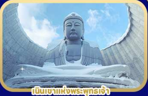
เป็นเขาแห่งพระพุทธรเจ้า