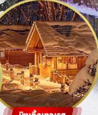
บึงเกิ้ลเทอเรส