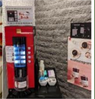
Sarasa Hotel Shinsaibashi