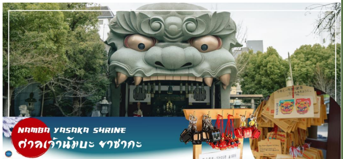
NAMBA YASAKA SHRINE ศาลเจ้าหนับะ ยาสากะ