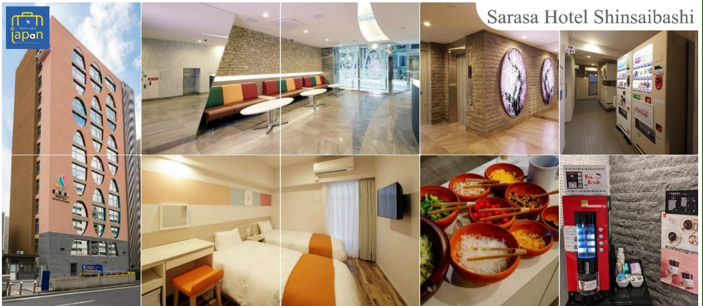
Sarasa Hotel Shinsaibashi

รับประทานอาหารเช้า ณ ห้องอาหารของโรงแรม (6)