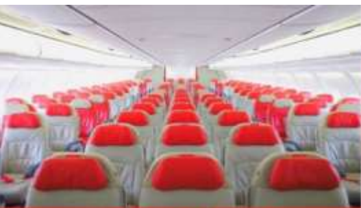
เครื่องบินลำใหญ่ 377 ที่นั่ง