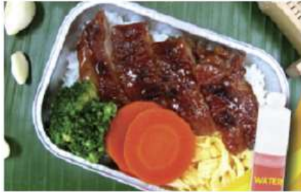
Chicken teriyaki with rice and water