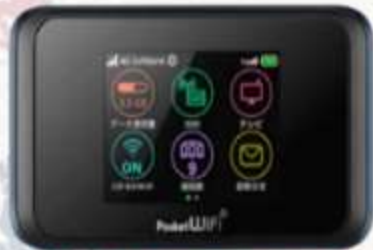
POCKET WIFI สำหรับนำไปใช้ในประเทศญี่ปุ่น