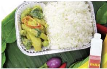
Green curry chicken with rice and water