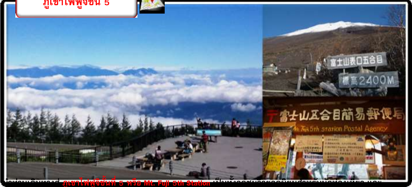
ก่อนออกเดินทางสู่ ภูเขาไฟฟูจิชั้นที่ 5 หรือ Mt. Fuji 5th Station เป็นแหล่งจุดชมดอกซากุระต้นแรกของประเทศญี่ปุ่น

จุดเริ่มต้นในการเดินทางขึ้นไปสู่ยอดภูเขาไฟฟูจิสำหรับบรรดานักปีนเขา ตั้งอยู่ที่จังหวัดยามานาชิ ประเทศญี่ปุ่น ภูเขาไฟฟูจิถูกแบ่งออกเป็น 10 สถานี หรือ 10 ระดับตามเส้นทางในการปีนขึ้นไปสู่ยอดเขา เนื่องจากระบบการคมนาคมที่ถูกพัฒนาขึ้นเรื่อยๆ จึงทำให้ในปัจจุบัน รถบัสสามารถวิ่งขึ้นมาได้ถึงบริเวณชั้นที่ 5 ส่งผลให้สถานีนี้ไม่ได้เป็นเพียงแค่สถานที่สำหรับนักปีนเขาเพียงอย่างเดียวเท่านั้น แต่ยังได้รับความนิยมอย่างมากในหมู่นักท่องเที่ยวที่ต้องการขึ้นมาชมภูเขาไฟฟูจิอย่างใกล้ชิดเต็มตา รวมถึงสามารถมองเห็นวิวของทะเลสาบทั้ง 5 แห่งที่รายล้อมอยู่ได้อีกด้วย