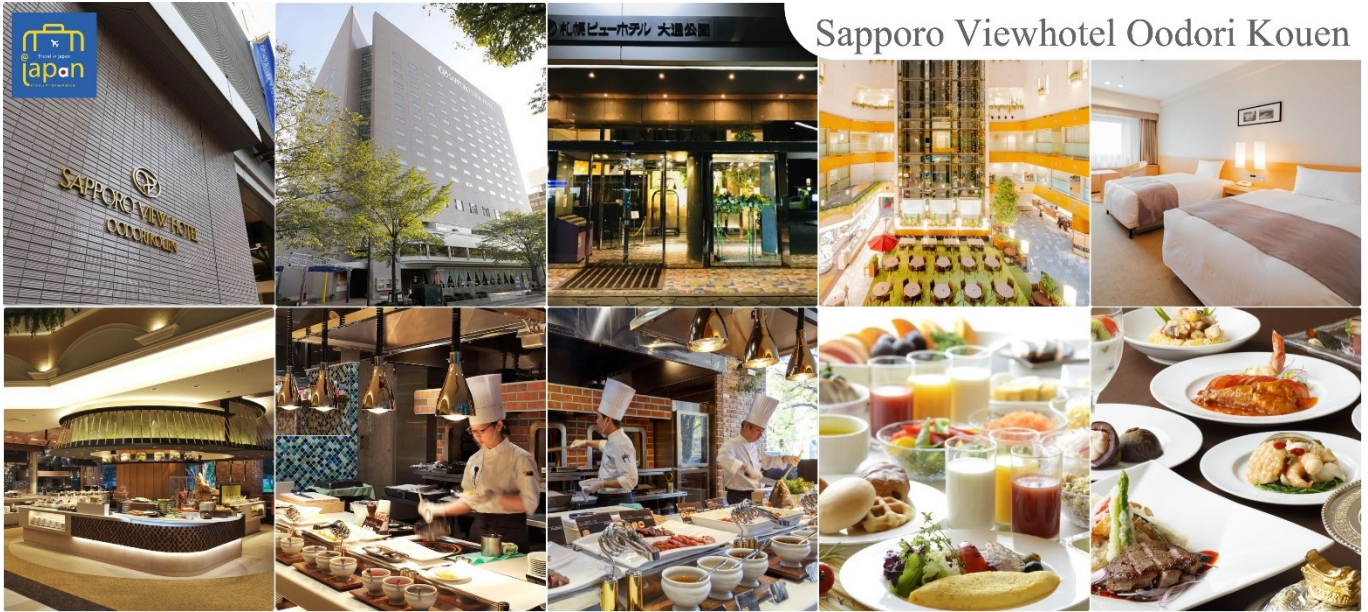
Sapporo Viewhotel Oodori Kouen

วันที่ห้า ซัปโปโร - โอตารุ - คลองโอตารุ - พิพิธภัณฑ์กล่องดนตรี - โรงเป่าแก้วคิตาดิชิ - Duty Free A&S Sapporo - โรงงานช็อคโกแลต - ซัปโปโปะทานุกิโคจิ