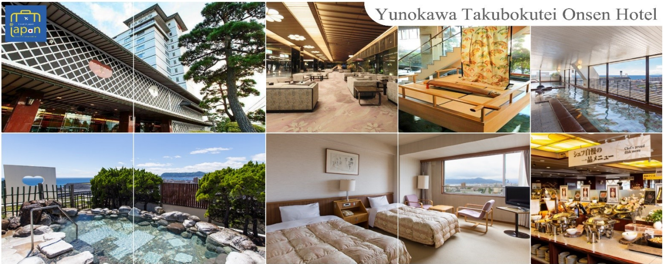
Yunokawa Takubokutei Onsen Hotel

YUNOKAWA TAKUBOKUTEI ONSEN HOTEL หรือเทียบเท่าระดับเดียวกัน