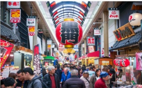
ตลาดคุโรมง