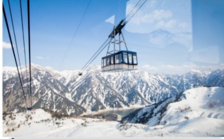
ขึ้นกระเช้าสู่เทือกเขากาเทยามา