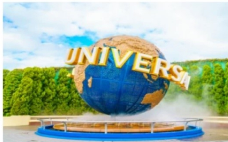
ยูนิเวอร์ซัล สตูดิโอส์