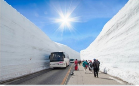
เจแปนแอลป์