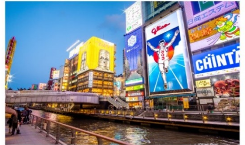
ย่านโดทงโบริ