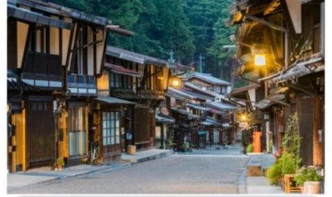
หมู่บ้านนารายณ์จุกุ