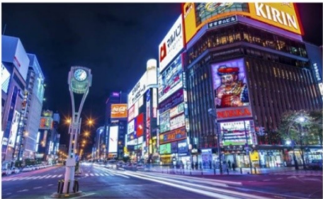
ย่านบันเทิงชูชิโนะ