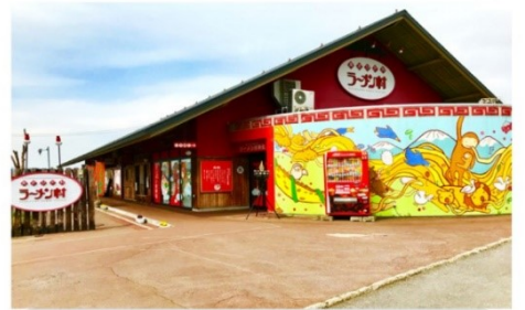
หมู่บ้านราเม็ง