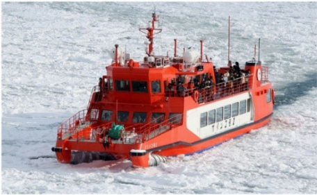
ล่องเรือตัดน้ำแข็ง