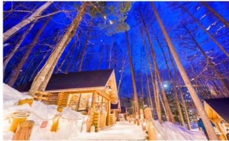
หมู่บ้านนิงเกิลเทอเรส