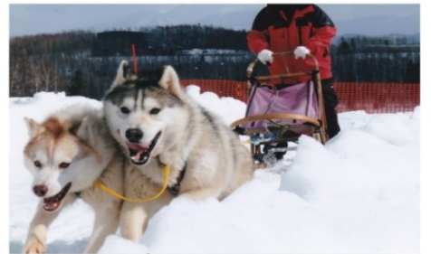
สุนัขลากเลื่อน