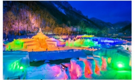
เทศกาลน้ำแข็งโซอุนเคียว