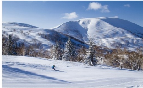
คิโรโรสกีรีสอร์ท