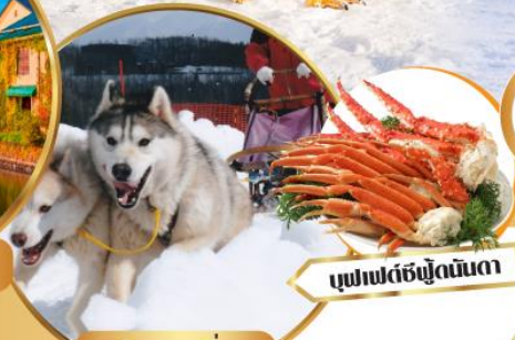
สุนัขลากเลื่อน