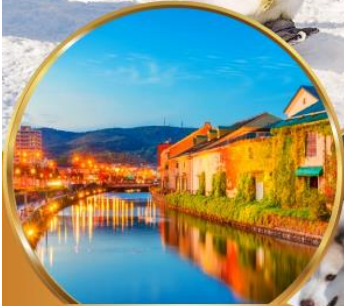
คลองโอดารุ