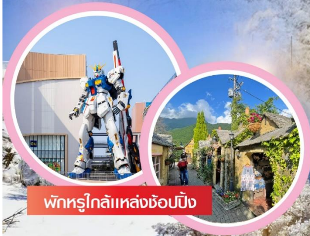
พักรูโกเลียแหล่งช้อปปิ้ง