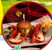
เมนูเชิควิน ลิวอร์ฟลู & ลิวอร์ฟลู