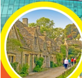
หมู่บ้านโบฮีเรีย