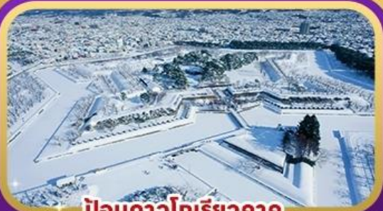
ป้อมดาวโทริยวาคู เดินทาง มกราคม - มีนาคม 2567