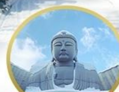
เป็นเขาพระพุทธรเจ้า