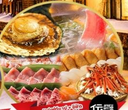
บุฟเฟ่ต์ปู 5 ชนิด อาหาร มากกว่า 50 เมนู