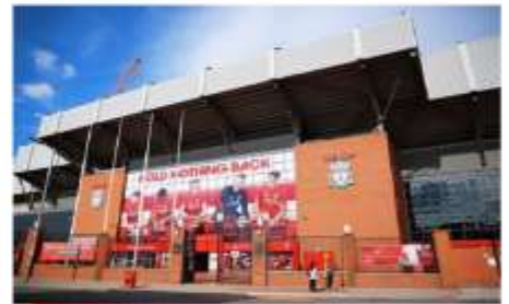
สนามแอนฟิลด์