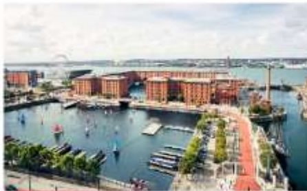
ลิเวอร์พูล