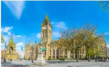
แมนเชสเตอร์