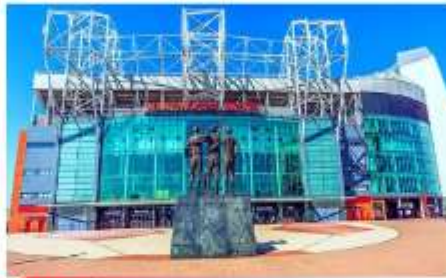
สนามโอลด์แทรฟฟอร์ด