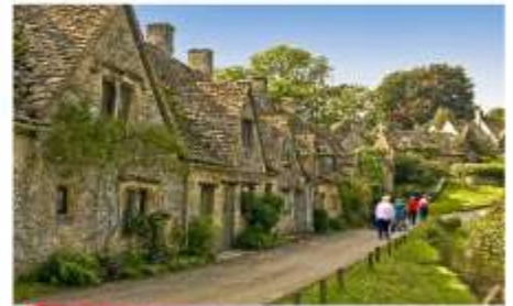
หมู่บ้านโบวรี