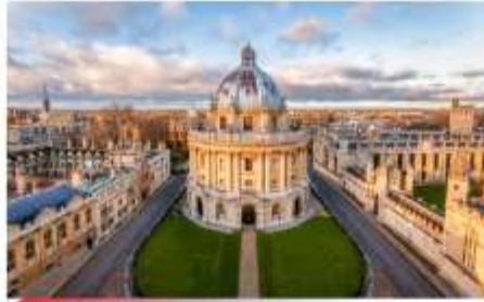
อ็อกฟอร์ด