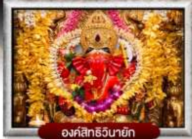
องค์สิทธินายัก