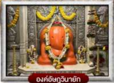
องค์อชันภูวินายัก