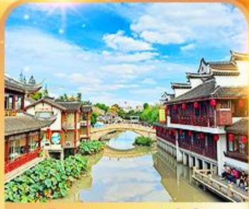
เมืองโบราณฉีเป่า