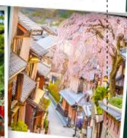
อึทากิชิยาม่า