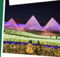
Nabana no sato