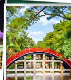
ศาลเจ้าสุมิโยชิ โทคะ