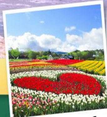
สวนบกกะโนะ ซาโตะ