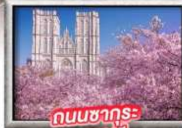
ถนนซากุระ ม.คยองฮี