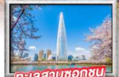
ทะเลสาบชอกซอน