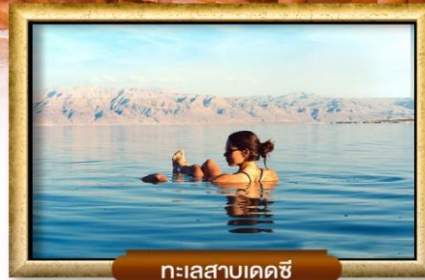
ทะเลสาบเดดซี