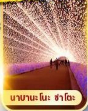
นาฮะ โนะ ซาโตะ