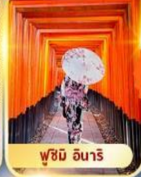
ฟูชิมิ อินาริ