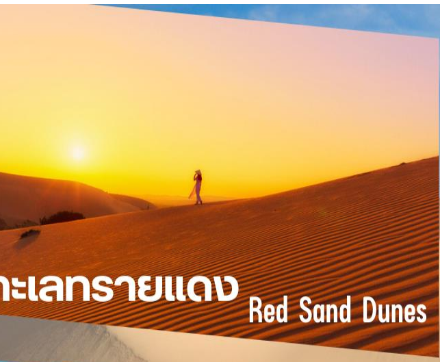
ทะเลทรายแดง Red Sand Dunes