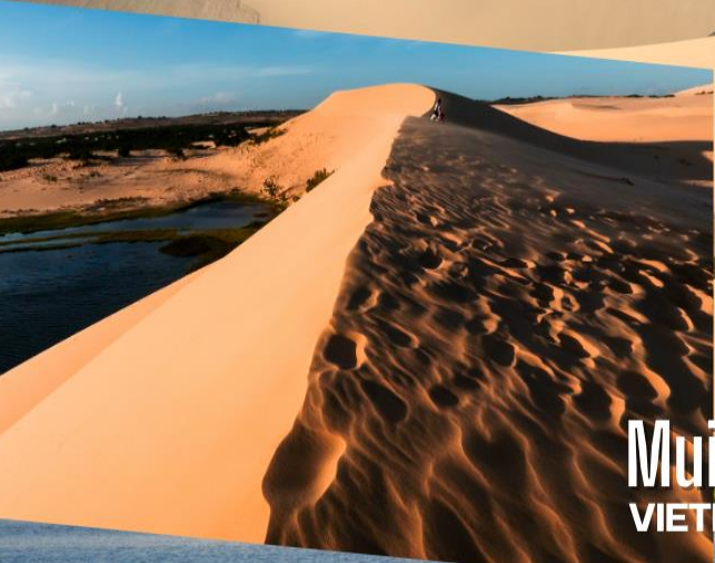
Mui Ne VIETNAM