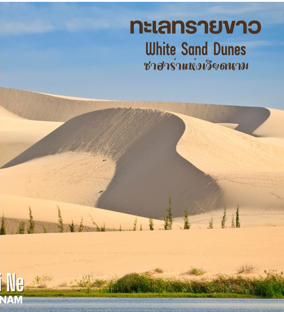
ทะเลทรายขาว White Sand Dunes ซาฮาราแห่งเวียดนาม