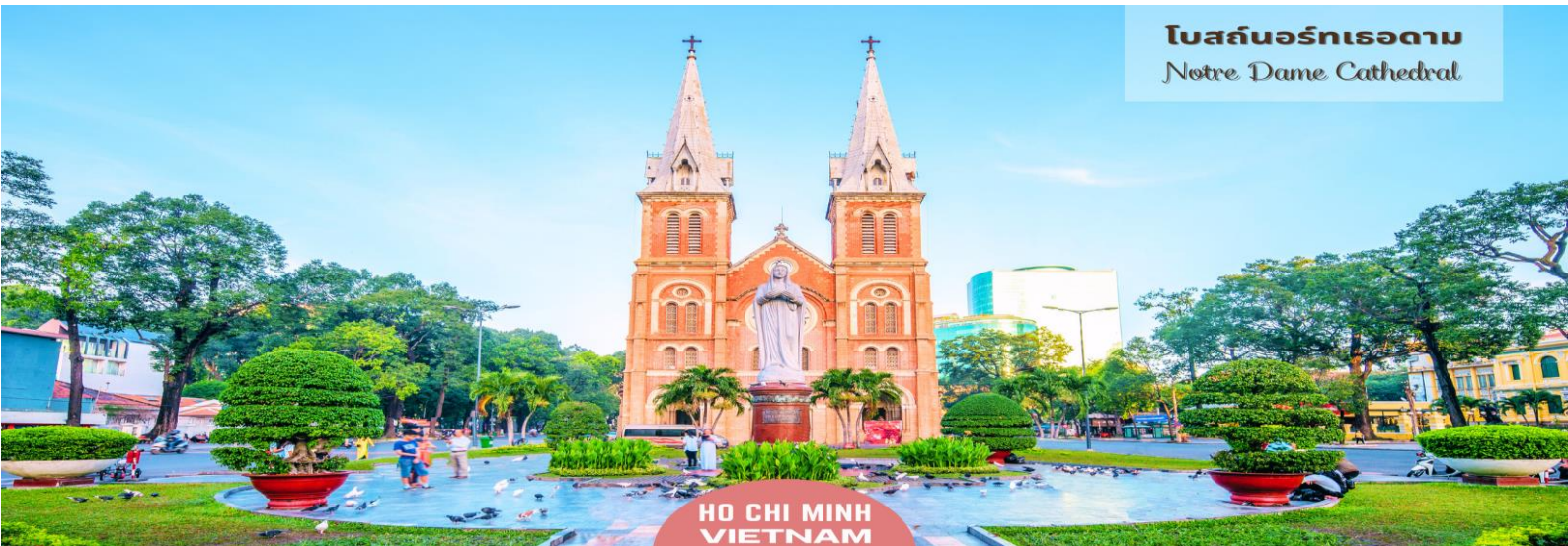
โบสถ์นอร์เทอดาม Notre Dame Cathedral

เลือกซื้อและส่งโปสการ์ดไปยังครอบครัว คนรัก คนรู้จัก หรือส่งให้ตนเองเพื่อเก็บเป็นความทรงจำระหว่างการเดินทาง เป็นจุดหมายปลายทางของนักท่องเที่ยวที่ต้องมาเยือน