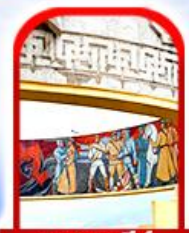
อนุสาวรีย์ ไซซาน