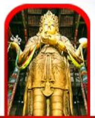
วัดกานดา