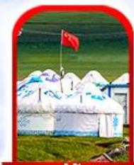
หมู่บ้าน พื้นเมือง