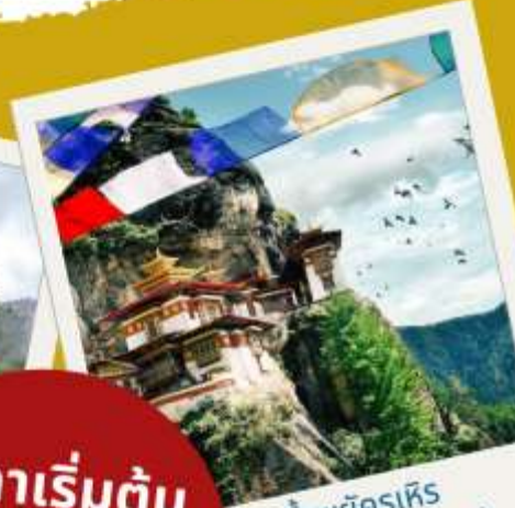
วัดถ้ำพัยศรี (ยอดเขาวัดถักซัง)