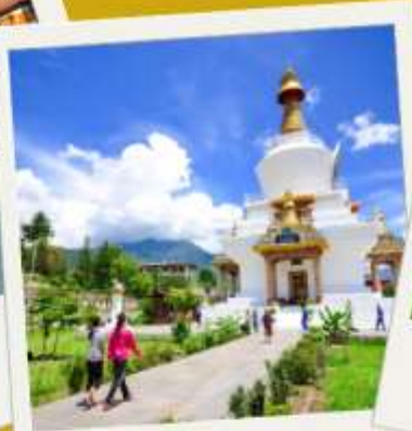
National Memorial Chorten