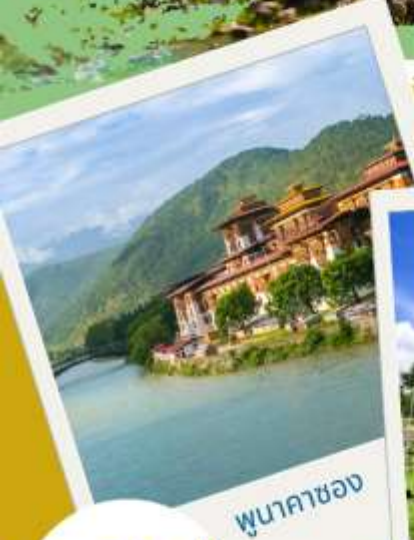
พุนาคาซอง