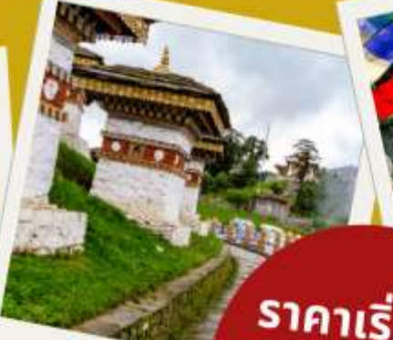
โตซูลาฟา