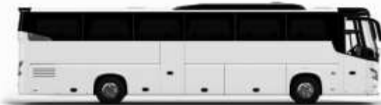
รถปรับอากาศ 1 ชั้น

ค่าที่พักตามที่ระบุในรายการหรือเทียบเท่าระดับเดียวกัน (พักห้องละ 2 ท่าน) หากประเภทห้องที่ท่านริเสวนาเดิม อาทิ เช่น ริเสวนาคือพักเป็น TWIN BED หรือ DOUBLE BED ทางบริษัทขอสงวนสิทธิ์ในการปรับประเภทห้องพัก เป็นตามที่โรงแรมมีอยู่ โดยไม่ต้องแจ้งให้ทราบล่วงหน้า