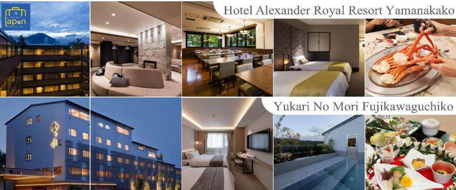
Hotel Alexander Royal Resort Yamanakako