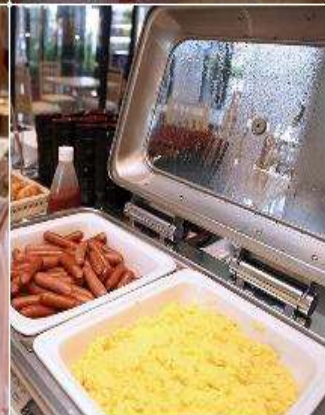
Asia Narita Hotel