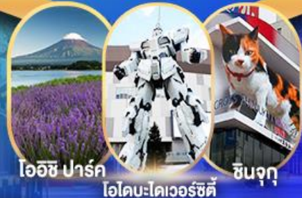
ไออิชิ ปาร์ค ไอโคะ-ไดเวอร์ซิตี ชินจุกุ

อิสระท่องเที่ยวตามอัธยาศัย หรือเลือกซื้อทัวร์เสริมโตเกียวดิสนีย์แลนด์ แวะจุดชมวิวไออิชิปาร์ค ฟุจิชิบะ ซาคุระ ชมทุ่งดอกพืชมอส พิพิธภัณฑสถานดินไหว DUTY FREE ไอโคะ-ไดเวอร์ซิตี ซุปป์ชินจุกุ