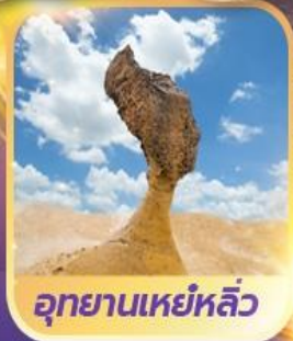
อุทยานเหยหลิว