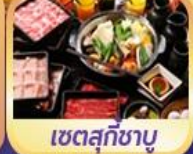
เซตสุกียาบู