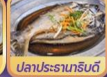
ปลาประธาราหรับดี