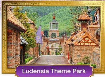
Ludensia Theme Park