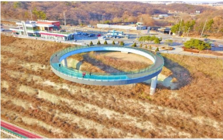
อารามรู สกายวอล์ค