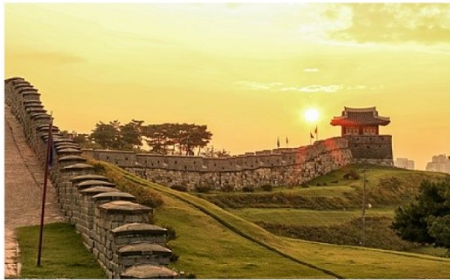
ป้อมปราการฮวาซอง