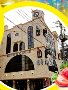
คาเฟ่แฮรี่พ็อตเตอร์