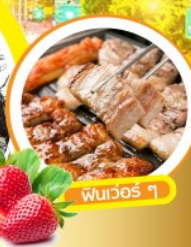
พวเวอร์ ๆ