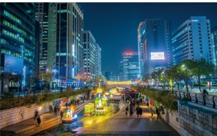
คลองชองกเยซ็อน