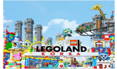
สวนสนุกเลโก้แลนด์