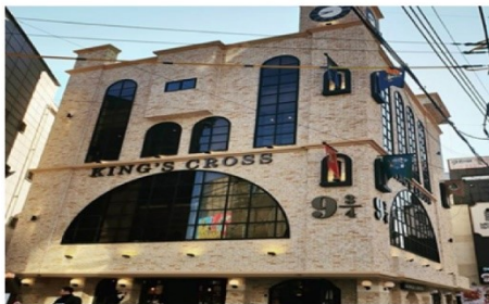
กาแฟแฮรี่พ็อตเตอร์