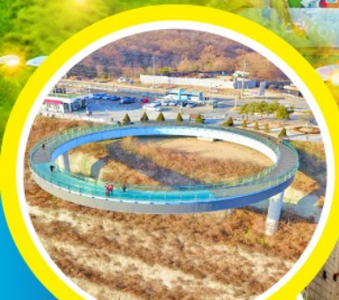
อารามรู สกายวอล์ค