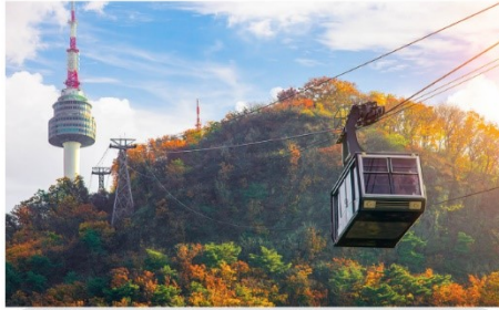
กระเช้าลอยฟ้า ณ โซลทาวเวอร์