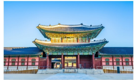
พระราชวังเคียงบก