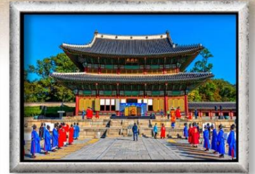
พระราชวังชางด็อกกุง