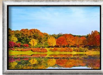
โอลิมปิกพาร์ค