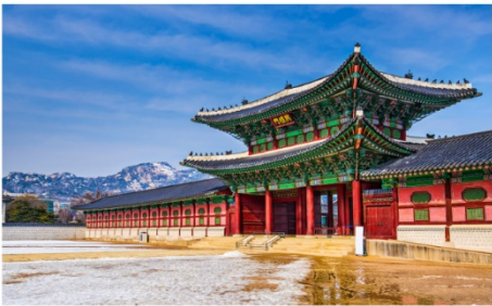
พระราชวังเคียงบก