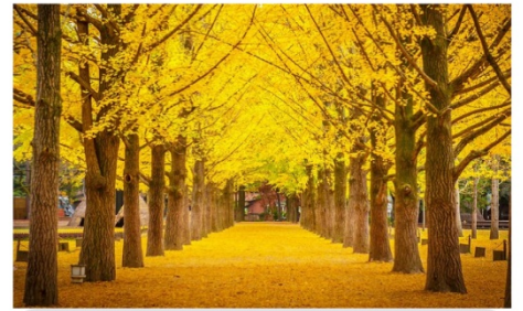
ล่องเรือเกาะนามิ