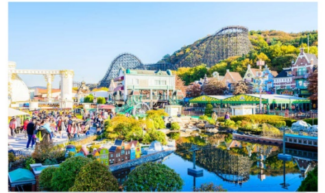
สวนสนุกเอเวอร์แลนด์