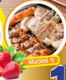
พุนเวอร์ ๑