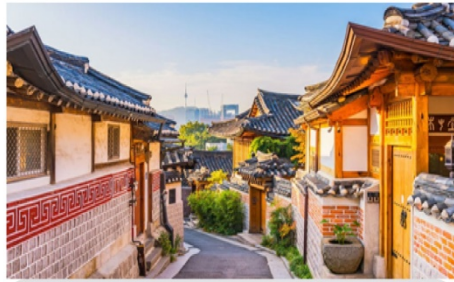
หมู่บ้านโบราณฮุกซอน