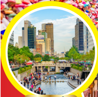
คลองชองกยช็อน