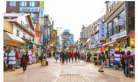
ย่านฮงแด