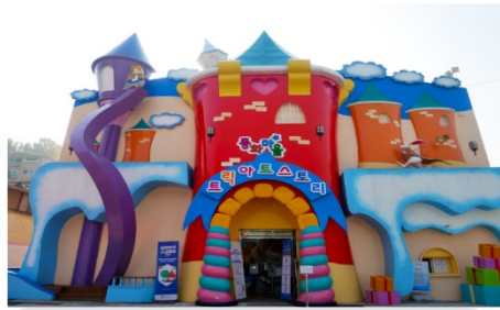
หมู่บ้านเทพนิยายซองโวลดง