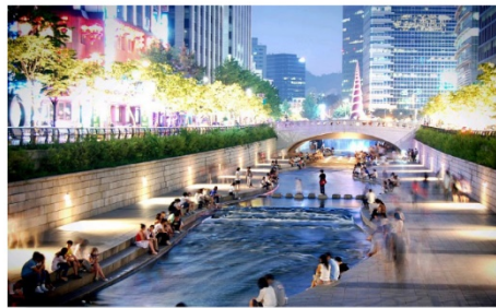
คลองชองเกซอน