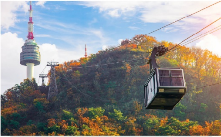
กระเช้าลอยฟ้า ณ โซลทาวเวอร์