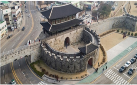
ป้อมปราการฮวาซอง