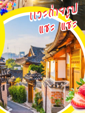
แควต่างรูป แซ้ แซ้