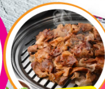
พินเวอร์ ๑