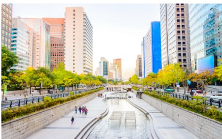
คลองชองเกซอน