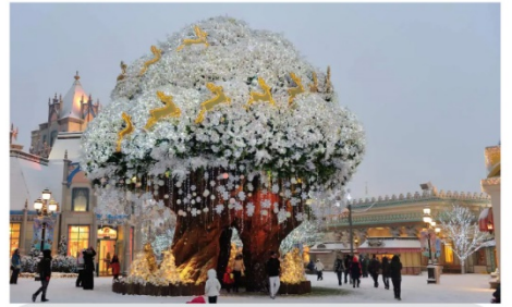
สวนสนุกเอเวอร์แลนด์