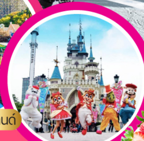
ลือตเวเิลด์