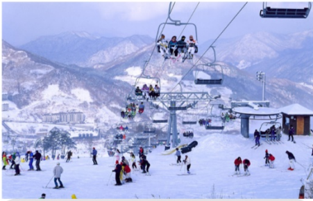
กิจกรรมลานสกี