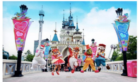
ลือตเต็เวิลด์