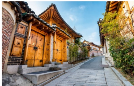
หมู่บ้านโบราณบุกซอน