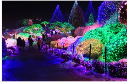
ชมเทศกาลประดับไฟฤดูหนาว