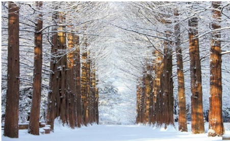
เกาะนามิ