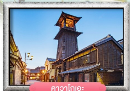
คาวาโกเอะ