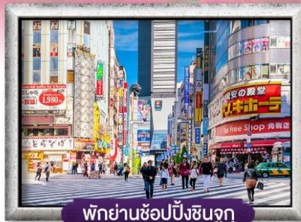
พิกย่านช้อปปิ้งชินจูกุ