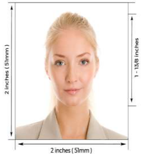
India Visa & OCI