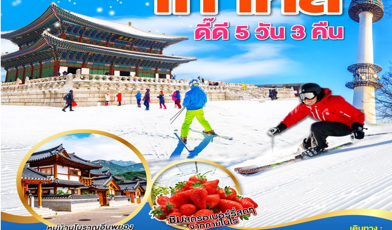
หมู่บ้านโบราณอินพยอง