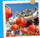
อินชอนทาวน์