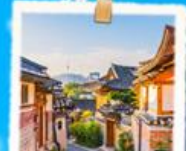
มูกชอนฮันอก