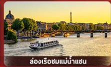
ล่องเรือชมแม่น้ำแซน

จัดรีสคอนคอร์ด์ ถนนฌ็องเซลิเซ่ ล่องเรือชมแม่น้ำแซน