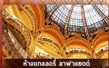
ห้างแลออร์ ลาฟาแยตต์