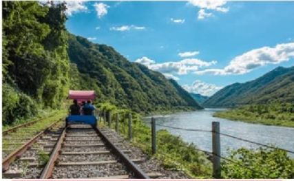
( Rail Bike )