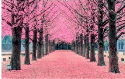
เกาะนามิ