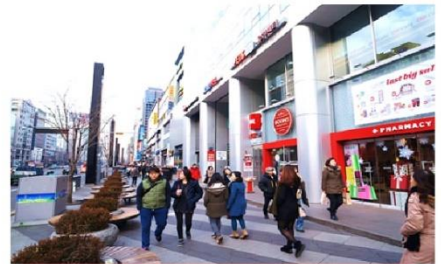
ช้อปปิ้งคังนัม