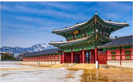
พระราชวังชางดีอกุง