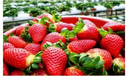
ฟาร์มสตอเบอร์รี่