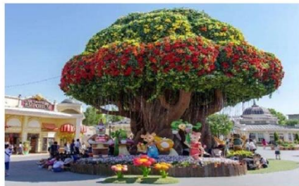
สวนสนุกเอเวอร์แลนด์