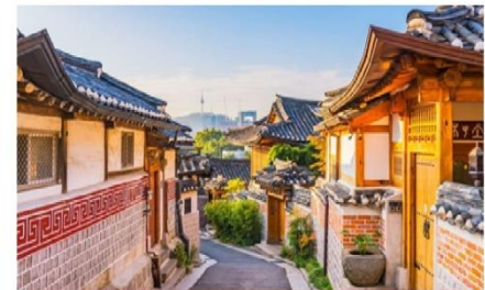
หมู่บ้านโบราณฮุกซอน