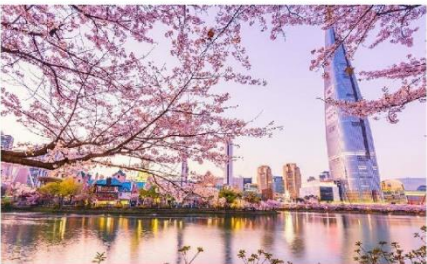
ชมซากุระทะเลสาบชอกซอน