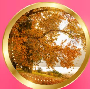
AUTUMN มีนาคม-พฤษภาคม 11 °C - 25 °C