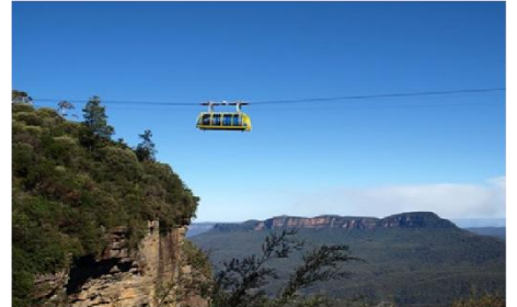
ขึ้นกระเช้าลอยฟ้า