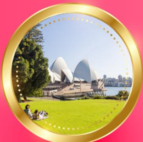
SUMMER ธันวาคม-กุมภาพันธ์ 17 °C - 26 °C