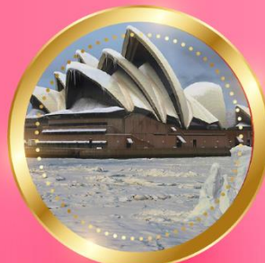
WINTER มิถุนายน-สิงหาคม 8 °C - 18 °C