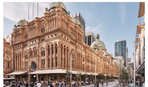
ควีนวิกตอเรียบิลдинг