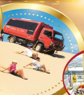
นั่งรถ4WDทะเลลุยเนินทราย