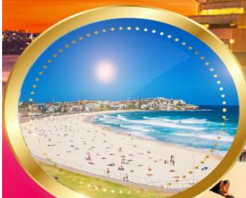
หาดบอนได

เช็किन นั่งรถ4WDทะเลลุยเนินทราย ล่องเรืออ่าวซิดนีย์