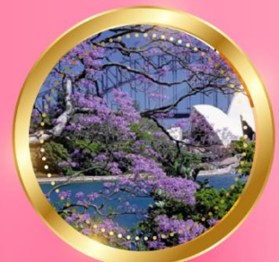
SPRING กันยายน-พฤศจิกายน 11 °C - 24 °C