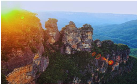
หุบเขาสีน้ำเงิน