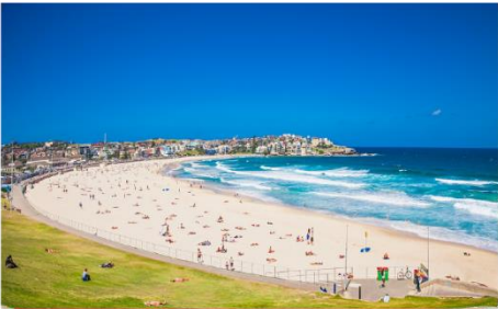
หาดบอนได