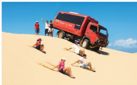
พอร์ต สตีเฟน