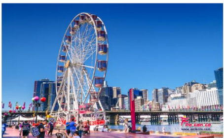
คาร์ลิ่งฮาร์เบอร์