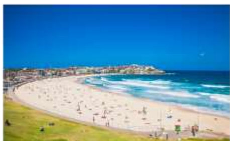
หาดบอนได