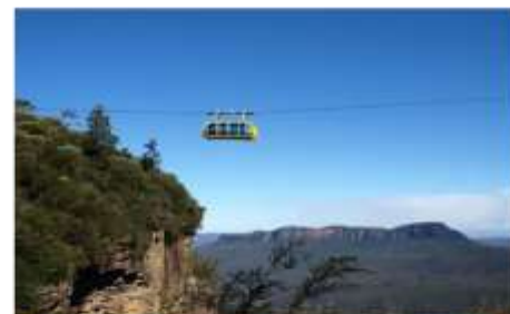
ขึ้นกระเช้าลอยฟ้า