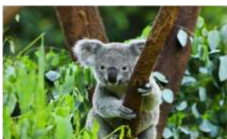
โคอาล่าปาร์ค