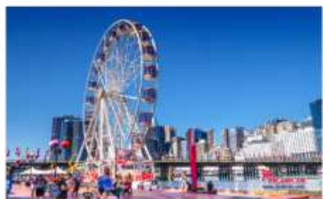
ดาร์ลิ่งฮาร์เบอร์