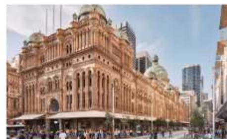
ควีนวิกตอเรียมิลดิง