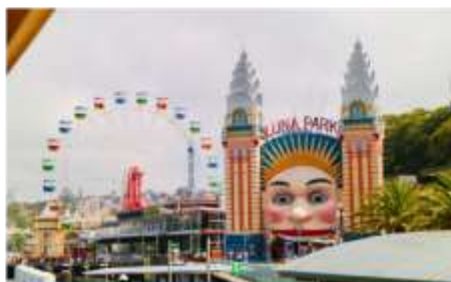
สวนสนุกลูน่า พาร์ค ซิดนีย์