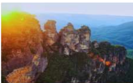
หุบเขาสีน้ำเงิน