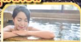
แช่น้ำแร่ร้อนตัว