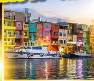
หมู่บ้านประมงเจิ้นปิง