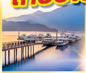
ทะเลสาบสุริยอันทรา