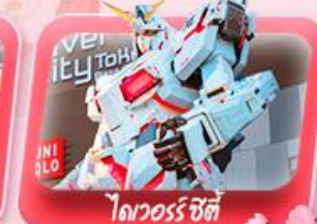
ไทเวอร์ซิตี