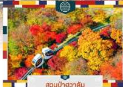
สวนป่าฮวาดัม