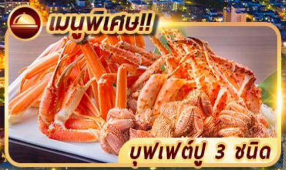
เมนูพิเศษ!!