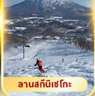
ลานสกีนิเซโกะ