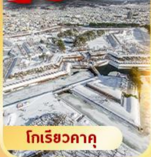
โกเรียวกาคู