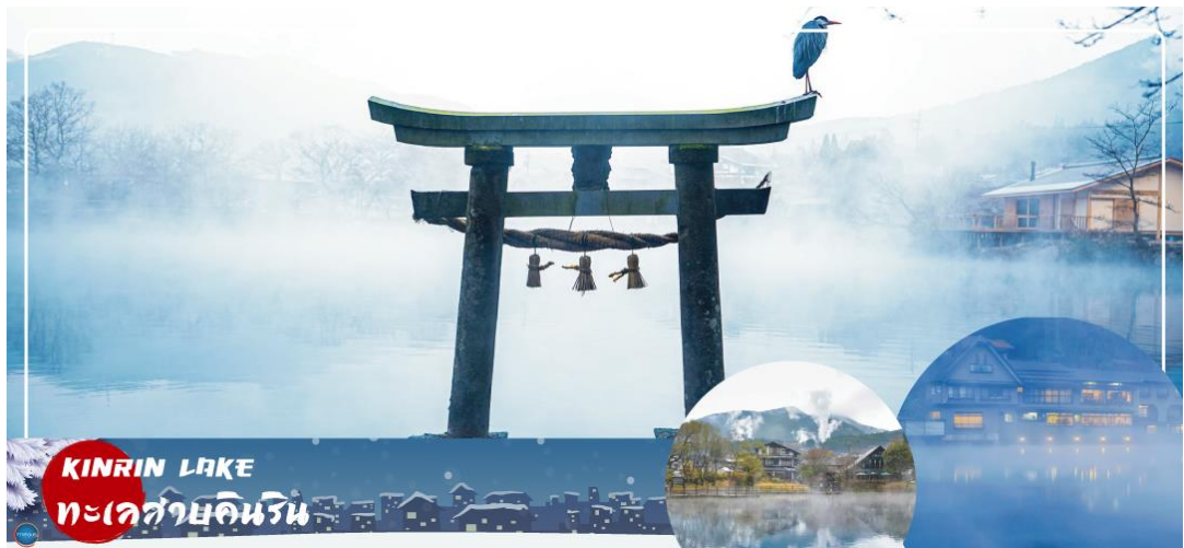
KINRIN LAKE ทะเลสาบคินริน