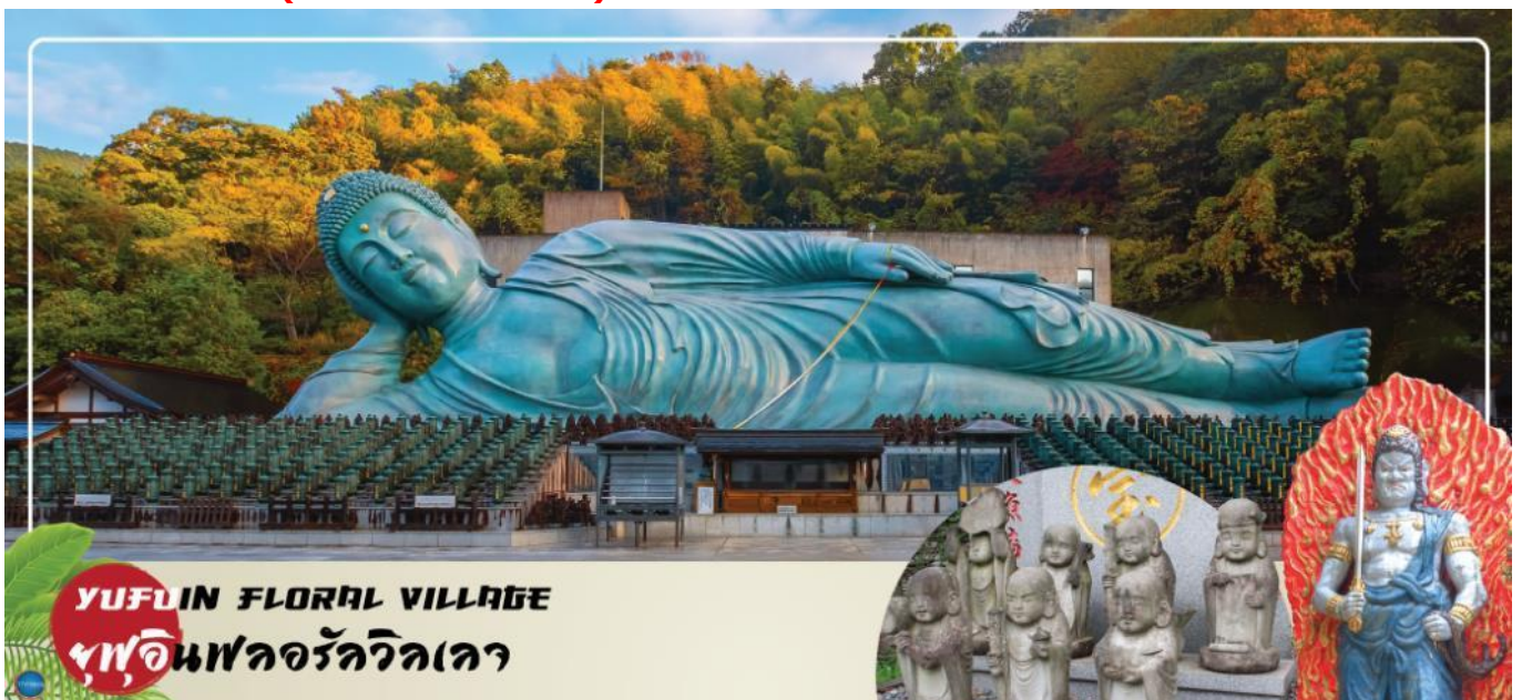
YUFUIN FLORAL VILLAGE หมู่บ้านดอกไม้วิจิตร

เลือกรับประทานอาหารกลางวัน ณ หมู่บ้านยูฟุอินตามอัตรา 3 Cash Back ท่านละ 1000 เยน (จ่ายโดยไกด์หน้างาน)