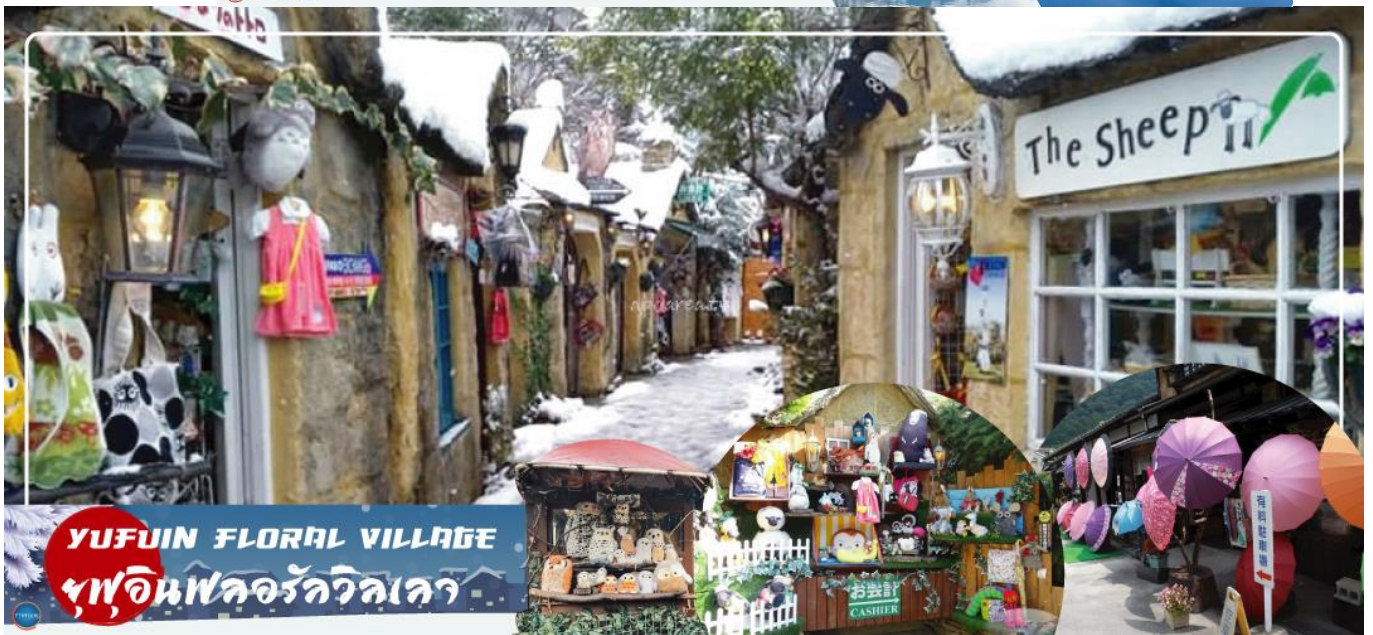
YUFUIN FLORAL VILLAGE หมู่บ้านดอกไม้วิจิตร